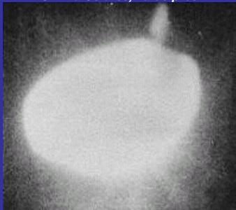
OVNI à Colares, vu de près.